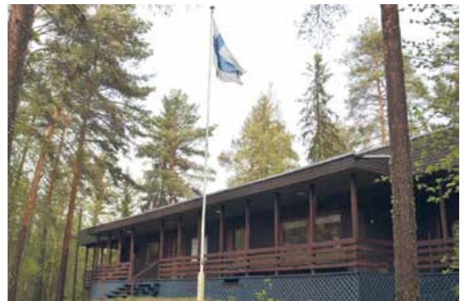
Seura-Ranta on palvellut seurakunnan toimintaa ja jäseniään vuosikymmenten ajan.

Seurakunnan Vöyrillä sijaitseva leirikeskus Seura-Ranta palveli vielä kesällä 2024 leirikäytössä, mutta syksyllä tehdyn kuntakartoituksen myötä sen käytöstä on luovuttu. Rakennus vaatisi laajaa kunnostamista, ja hallinnossa on todettu, että se ei toiminnallisesti ja taloudellisesti ole asia, johon seurakunta lähtisi tekemään mittavaa investointia. Toistaiseksi seurakunnan leirit järjestetään ulkopuolisten toimijoiden leirikeskuisissa kohtuullisen matkan säteellä Laihialta. Tavoitteena on, että Seura-Ranta löytäisi uuden omistajan, joka pystyisi hyödyntämään kaunista Røykäsjärven miljöötä toiminnassaan.