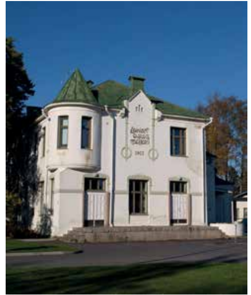
Entiselle Meijeri-rakennukselle etsitään uutta omistajaa.

Kaunis kotikirkkomme saa parhailtaan uutta maalia pintaan. Maalausliike Reinisalo Oy Vaasasta on urakoinut kirkon maalauksen parissa keväästä saakka ja valmista pitäisi tulla syyskuun loppuun mennessä. Urakassa vanhat, irtoavat maalikerrokset rapsutetaan pois ja pinnat maalataan uudelleen kahteen kertaan. Lisäksi ikkunanpielet kunnostetaan ja maalataan. Urakassa tulee kulumaan maalia noin 550 litraa!