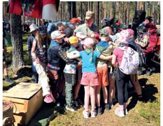
Kiitokseksi alaleiripäällikölle sudenpentujen teletappihali -- vaiko sittenkin laihialainen sauna.