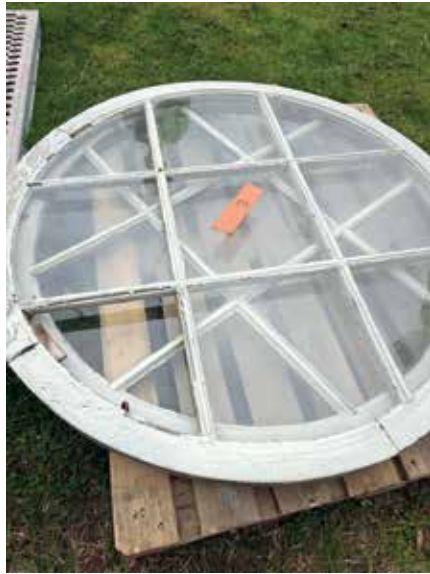
Kirkon ikkunat menossa kunnostettavaksi.