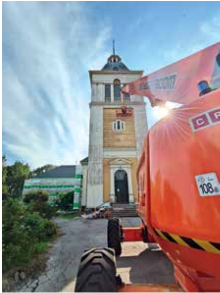
Kirkon tornin maalaukseen tarvitaan jykevää nosturia.