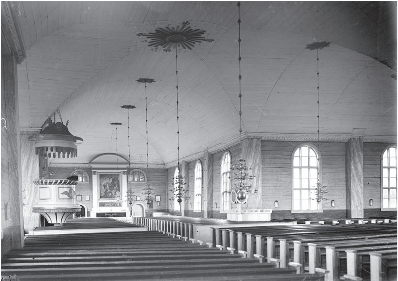
Laihian kirkon interiööri vuodelta 1900.

2020-luvun seurakunta on erilainen kuin vuosisatoja sitten, mutta ydin on pysynyt samana: kotikirkon kellojensoitto kutsuu sunnuntain jumalanpalvelukseen, evankeliumia saarnataan ja eletään todeksi ihmisten kesellä ja heidän kanssaan.