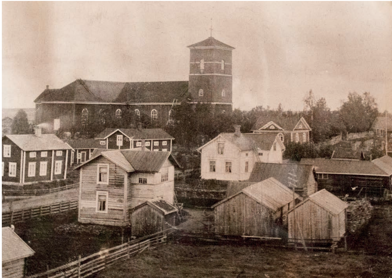
Laihian kirkko ennen 1910-luvun remonttia.

Kirkosta löytyvät esineet muistuttavat osaltaan seurakunnan pitkästä historiasta – kirkon pohjoissiiven kirkkomuseoon on tallennettu historiaa ensimmäisen kirkon pyhimysveistoksista alkaen, ja esimerkiksi saarnatuolin kaiteella oleva messinkikynttelikkö oli lahja pikkuvihan aikana Laihialla olleen husaarirykmentin kapteenilta.