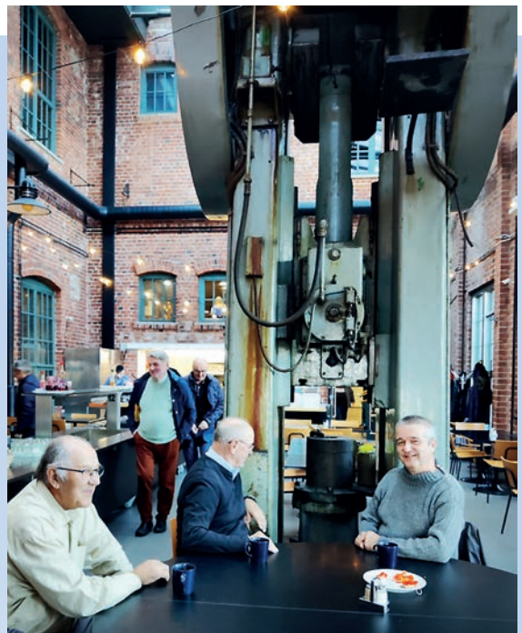
Paukun keskuksessa kaffilla.